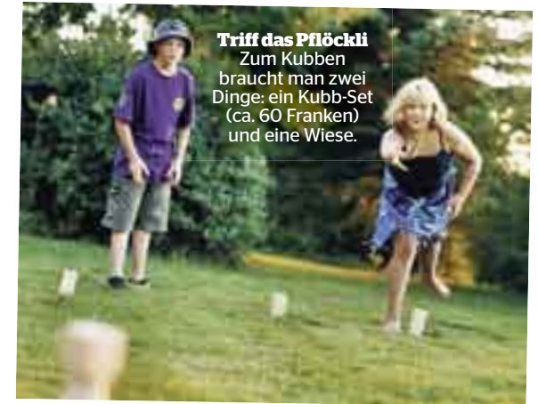
Triff das Pflöckli Zum Kubben braucht man zwei Dinge: ein Kubb-Set (ca. 60 Franken) und eine Wiese.

Die WM findet jedes Jahr in Schweden statt.